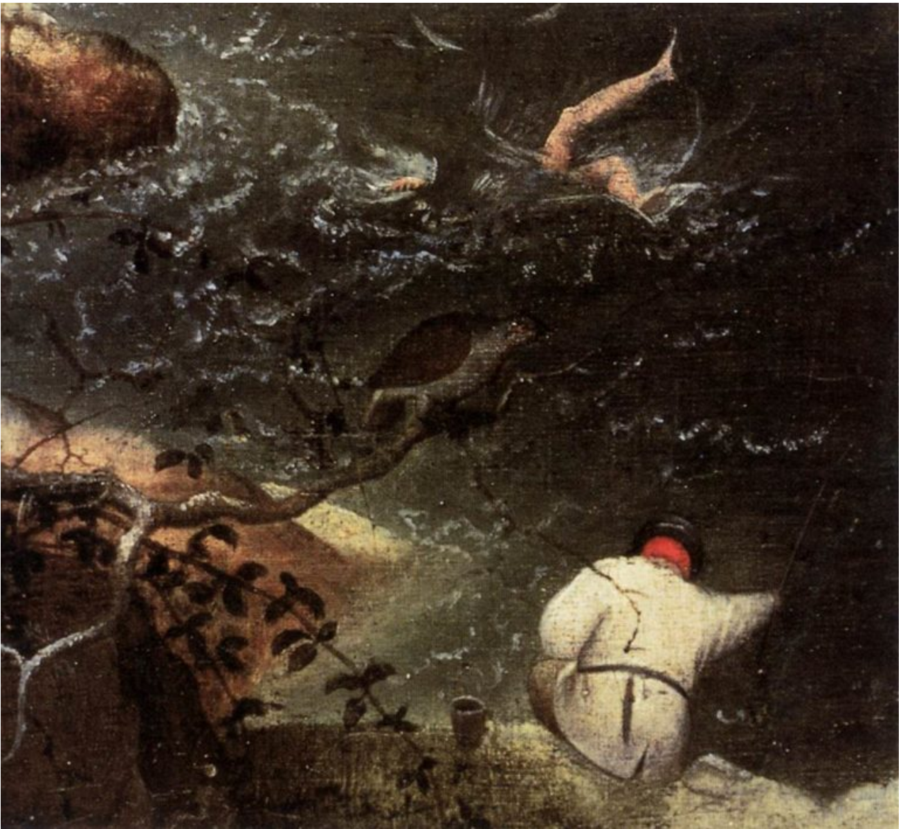
Dettaglio de La caduta di Icaro di Pieter Bruegel il Vecchio (1558 circa)

Il secondo utilizzo ha a che fare con la geografia.